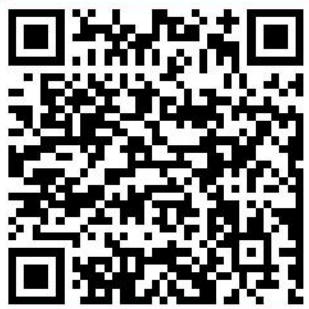
年度大会报名链接

4、报名方式：为了方便会务安排，参会人员请于5月17日（周五）前扫描下方二维码提交报名，为避免信息有误，本次会议只采用问卷星报名，不接受电话或微信报名。