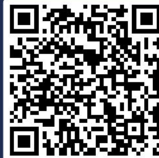
龙头企业参观交流报名